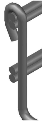
Peralte 66 mm